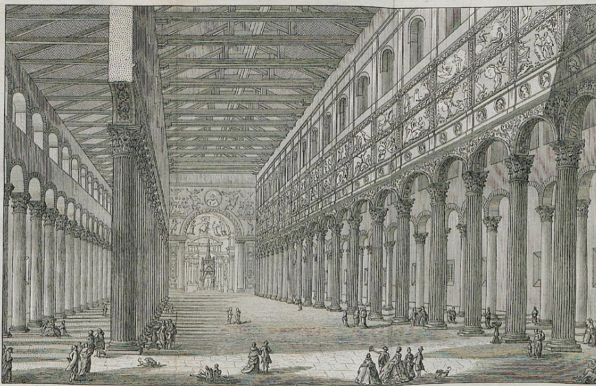
INTÉRIEUR DE L'ÉGLISE ET BASILIQUE DE SAINT PAUL DE ROME

S. Paul de Rome. Après la description que je viens de faire d'une Basilique telle qu'elle étoit chez les Romains, il ne me resteroit rien à dire de celle de Saint-Paul, si l'on y trouvoit le goût, la régularité, la bonne Architecture des modèles dont elle est la copie; mais, à la forme & à la distribution près, on n'y voit rien de cette Science des proportions & des ornemens qui frappoient sans doute dans les Basiliques Antiques. Rien ne prouve mieux que ce monument à quel point étoit déjà déchu l'Architecture sous Constantin. Car je ne crois pas que ce soit plutôt à la simplicité Chrétienne, qu'à l'ignorance, qu'il faille attri-