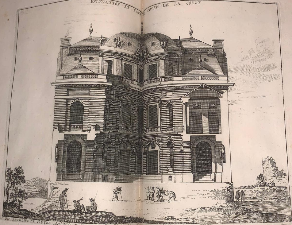
M. ANTOINE LE PASTRE Architecte du Roy. avec Privilège.